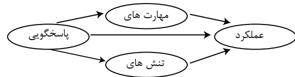
تصویر ۱: مدل مفهومی تحقیق

عملکرد کارکنان تأثیرات بالقوه‌ای برای رسیدن به اهداف سازمان دارند اما در هر سازمانی به‌خصوص دانشگاه، عملکرد شغلی کارکنان، مطابق با مسیر هدف سازمان طی نخواهد شد و کارکنان با پاسخگویی شخصی و سطحی خود مانع رسیدن اهداف سازمان به‌صورت ایدئال و منطقی می‌باشند. ما در این تحقیق سعی بر آن داریم تا از طریق پاسخگویی فردی کارکنان تأثیر آن را بر عملکرد شغلی بیابیم و مهارت سیاسی و تنش شغلی کارکنان را به‌عنوان نقش میانجی به کار ببریم و آیا رابطه‌ای با عملکرد شغلی افراد دارند؟ و آیا مهارت سیاسی و تنش شغلی بر پاسخگویی فردی افراد رابطه دارند که باعث تأثیر بر عملکرد شغلی آن‌ها گردد؟ و مسئله این تحقیق بیان می‌کند که آیا پاسخگویی یک شغل اگر با مهارت سیاسی انجام آن همراه شود عملکرد آن تغییری خواهد کرد یا خیر؟ و آیا این رابطه به‌وسیله تنش شغلی تقویت و یا کاهش پیدا خواهد کرد؟