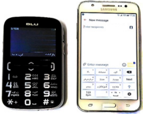
شکل ۱. گوشی لمسی مدل Galaxy J5 Prime (شکل سمت راست) و گوشی دکمه‌ای BLU مدل JOY (شکل سمت چپ)

برای این پژوهش گوشی لمسی سامسونگ مدل Galaxy Prime J5 انتخاب شد. طبق آخرین گزارش‌ها بین بیش از ۳۶ میلیون کاربر دستگاه اندرویدی ایرانی گوشی سامسونگ مدل Prime J5 بیشترین کاربر را دارد [۱۹]. همچنین از گوشی BLU مدل JOY، به دلیل داشتن دکمه‌هایی با سایز بزرگ و دکمه تماس اضطراری (SOS) مخصوص سالمندان، به‌عنوان گوشی دکمه‌ای استفاده شد. نوع و سایز صفحه‌کلید گوشی لمسی به شکل گوشی دکمه‌ای شبیه‌سازی شد تا عملکرد تایپ در هر دو گوشی در شرایط یکسان صورت گیرد (شکل ۱).